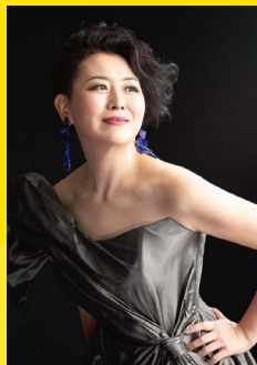
Yayoi TORIKI mezzo soprano メゾソプラノ/鳥木弥生 ★